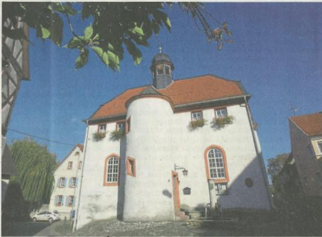
Ein kulturelles Kleinod mitten in Rheinhesse: Seit dem Jahr 1765 befindet sich die Kapelle St. Remigius im Flomborner Rathaus.

Das Motto im neuen Jahr lautet: „Heimat – Zusammenspiel“. Erneut geht es um die Zusammenstellung eines kulturell vielfältigen und spannenden Veranstaltungsprogramms, das den kulturellen Reichtum der Region abbilden soll. Veranstalter können Kommunen, städtische Institutionen, Museen, Vereine sowie Privatleute sein.